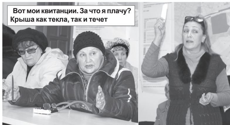
Вот мои квитанции. За что я плачу? Крыша как текла, так и течет